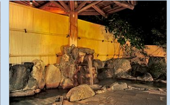
⑪湯の島温泉(豊根村)