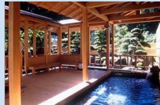
⑩免鹿嶋温泉 湯～らんどパルとよね(豊根村)