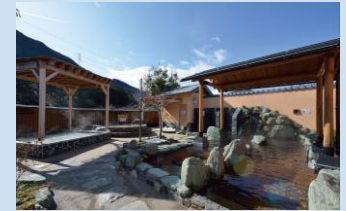
⑧とうえい温泉花まつりの湯(東栄町)