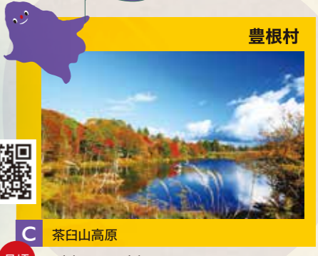
C 茶白山高原 見頃 9月中旬～11月中旬