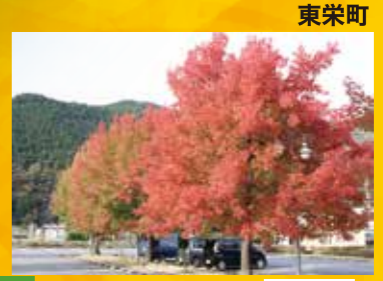
D とうえい温泉のトウカエデ 見頃 11月中旬～下旬頃