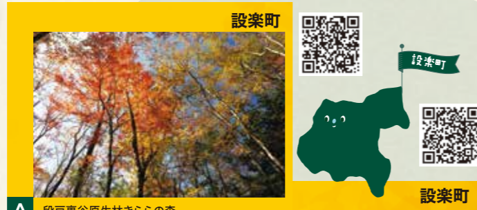
A 段戸裏谷原生林きららの森 見頃 10月下旬～11月上旬

東三河地域は、穏やかな気候と豊かな自然に恵まれ、南北に長い地形と山から海までの高低差もあることから、秋の紅葉シーズンを長く楽しめます。このマップでは、東三河8市町村の美しい紅葉・黄葉、秋の花のスポットの一部をご紹介します。ほの国東三河めぐりマップをお供に、東三河の美しい秋をごゆっくりお楽しみください。