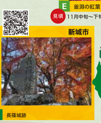
G 長篠城跡 見頃 11月下旬