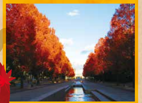
のんほいパーク [豊橋市]