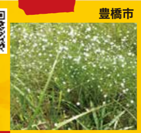
J 葦毛湿原のシラタマホシクサ 見頃 9月