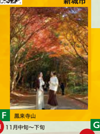
F 鳳来寺山 見頃 11月中旬～下旬