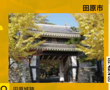
O 田原城跡 見頃 10月下旬～11月中旬頃