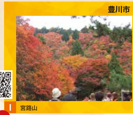
I 宮路山 見頃 11月中旬～12月上旬