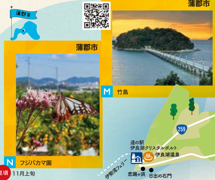
M 竹島 見頃 11月上旬