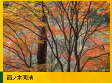
B 面ノ木園地 見頃 10月下旬～11月上旬