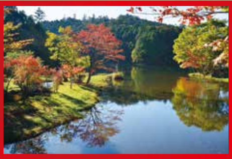
段戸裏谷原生林きららの森 [設楽町]