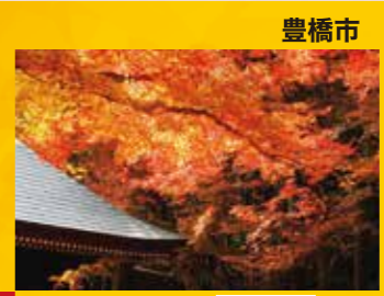
K 普門寺の紅葉 見頃 11月下旬～12月上旬