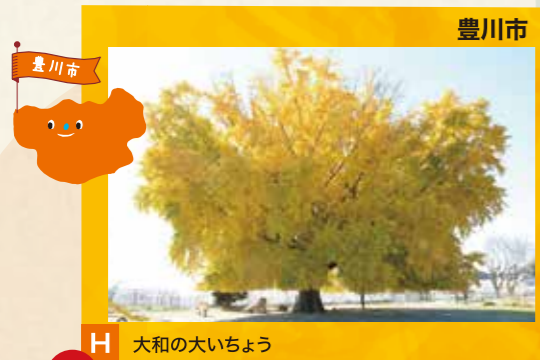
H 大和の大いちよう 見頃 11月中旬～12月上旬