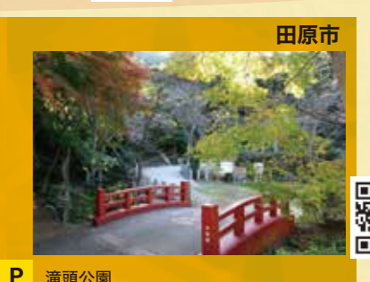
P 滝頭公園 見頃 11月下旬～12月上旬頃