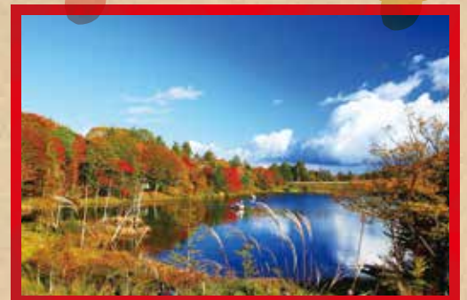
茶臼山高原 [豊根村]