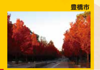
L のんはいパーク メタセコイア並木 見頃 11月下旬～12月上旬