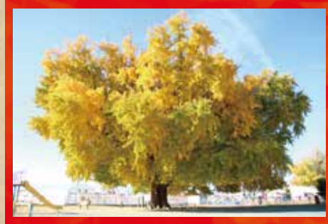
大和の大いちょう [豊川市]