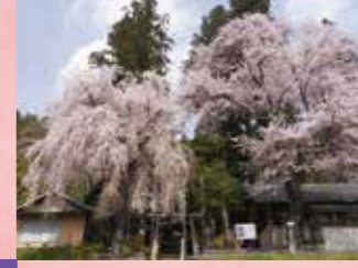
J 熊野神社のしだれ桜 見頃 4月上旬～中旬