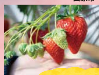
いちご狩り 甘くておいしいイチゴ♪ゴールデンウィークまで楽しめます。