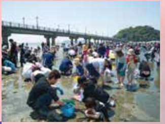
H 竹島海岸 潮干狩り