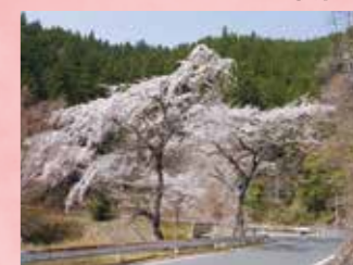
K みどり湖の桜 見頃 4月上旬～中旬