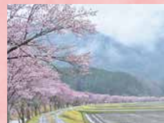
A 清水のコヒガンザクラ 見頃 4月上旬