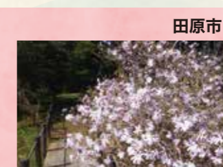
P 伊川津のシデコブシ 見頃 3月中旬～下旬