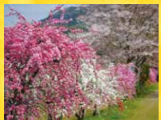
C しだれ花桃の里 見頃 4月上旬