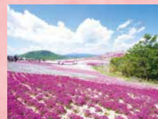
I 茶臼山高原 芝桜の丘 見頃 5月上旬～6月上旬