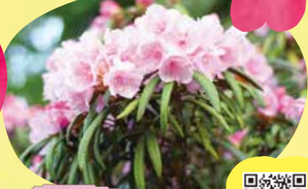
ホソバシャクナゲ