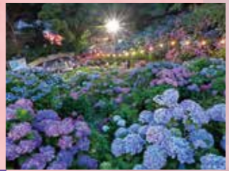
G 形原温泉 あじさいの里 見頃 6月上旬～下旬