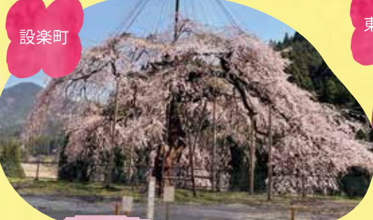
ウバヒガンザクラ