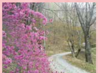
B 面ノ木園地 ミツバツツジ 見頃 4月上旬～中旬