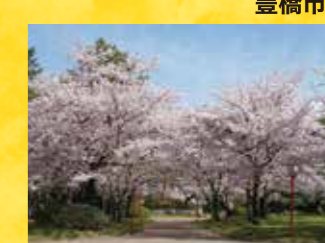
N 豊橋公園の桜 見頃 3月下旬～4月上旬