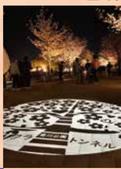
F 諏訪の桜トンネル 見頃 3月上旬